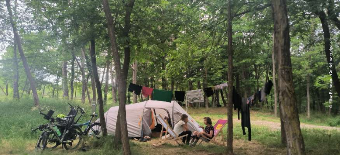
© Elise Baltassat - Guidoline et Rigolade